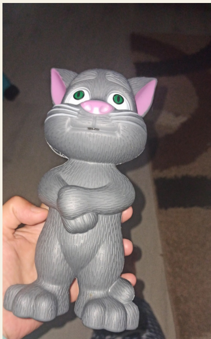
Igračka pokvarena, trgovac tvrdio da nije naručena kod njega

On objašnjava da nelegalni trgovci obično ne osjećaju da imaju obavezu po zakonu niti želju da grade dugoročne odnose