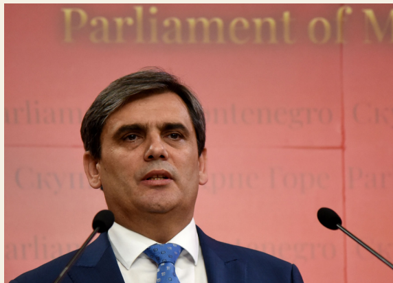
Ne odgovara na pitanja i ne donosi novo rješenje: Ibrahimović

Varijabilna koncesiona naknada iznosi šest odsto godišnjeg prihoda ako je on u prethodnoj godini bio između 300.000 i