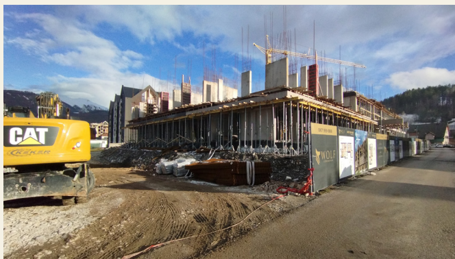
Radovi počeli na ljeto: Sa gradilišta "Wolf condominiuma" u Kolašinu

prethodno u izradi planskih dokumenata za teritoriju opštine Kolašin.