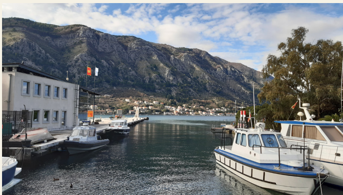
Iz Boka pilota poručuju da je presudom Upravnog suda potvrđena tvrdnja o nezakonitosti tenderskog postupka za pilotažu. Luka

Nakon više prigovora i tužbi Boka pilota, ugovori o koncesijama sa Lukom Kotor i Sea Pioneer potpisani su tek pred parlamentarne izbore u avgustu