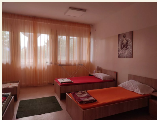
Jedna od soba u Zavodu “Komanski most”

„Bili su sami u sobi, a moj sin je zadobio povrede po glavi,