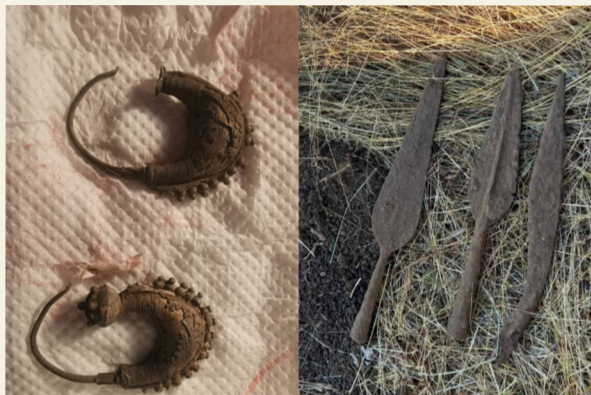
Ilirske minduše i razno oruđe – arheološki artefakti koji datiraju iz antičkog perioda i iskopani su u Crnoj Gori

“Ova kotlina, kao i uostalom čitava Crna Gora, predstavljala je bogatu spomeničku ‘zlatnu žicu’ na koju smo nagazili, ali ne samo što je nijesmo eksploitalisali, nego smo je bezrasudno