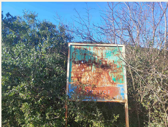
Ovako trenutno izgleda informaciona tabla na prilazu Samoboru.

do kasnog srednjeg vijeka. Prema njegovom pisanju, Budva je bila svjetski numizmatički centar po nalazima srebrnog novca iz rimskog perioda, a najbogatija crnogorska riznica kulturnog