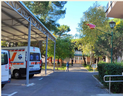
Šticienici dosta vremena provode napolju

Strategije za integraciju osoba sa invaliditetom i strategije